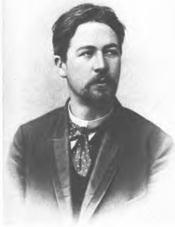
А. П. ЧЕХОВ. Фотография 1893 г.